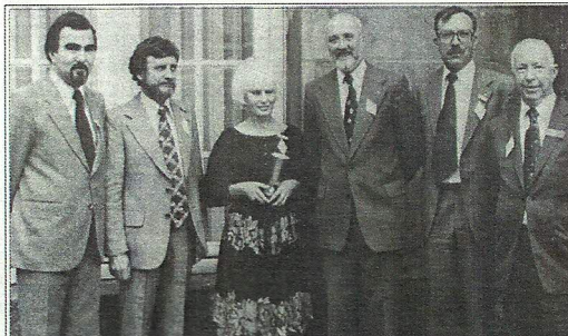
F6CIU F6EDF VE2DDR VK9XR ON6FN VE7ZQ AG de l'ARAS-REF 72. 1978 Le Mans.